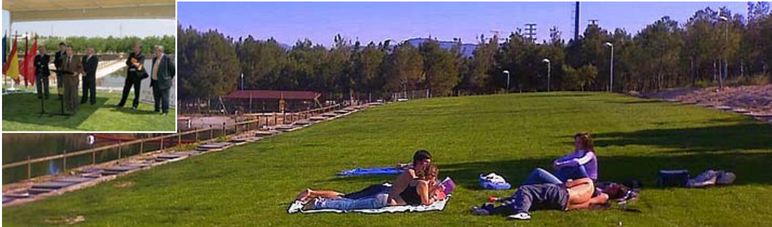
Inauguración depuradora de Campus Universitario de Espinardo, Murcia, 2006. Superficie 824 m 2 y volumen tratamiento constante . 500 m 3 /día.

Esta tecnología de depuración ecológica de aguas residuales se encuentra protegida por las patentes : P200000186, US-6,841,071-B2, W0153220, MX243346, P200502751, EP1273556, PI0017081-0, ZA2002/5087 y AU780170.